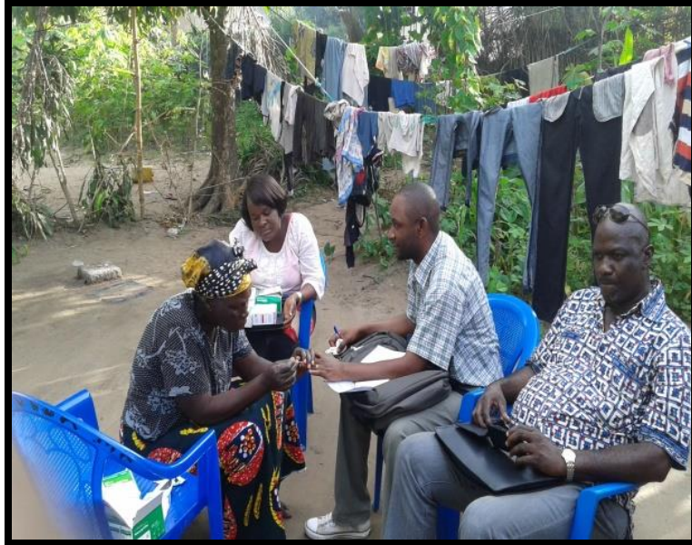
Sensibilisation de la communauté avant la campagne de distribution de masse des MILDA Le recosite fait le TDR dans le SSC