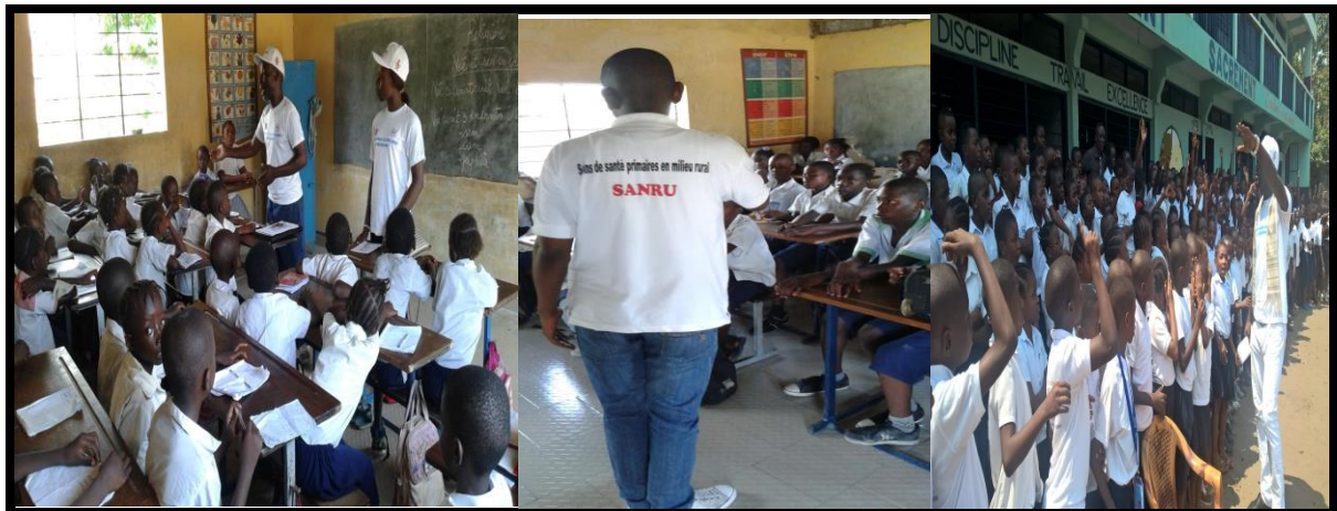
Pendant la sensibilisation à l'école GYAVIRA par les acteurs de la société civile

Il s'agit ici d'une activité de terrain qui visait 54.000 écoliers. Une séance de travail pour harmoniser l'agenda de l'activité s'est organisée avec les directeurs des écoles. Le jour du début de la sensibilisation a été fixé par consensus. Le déroulement s'est fait dans une très bonne ambiance pendant la sensibilisation sur la transmission, la prévention et la prise en charge du paludisme. Un accent particulier a été mis sur l'utilisation correcte de la MILD.