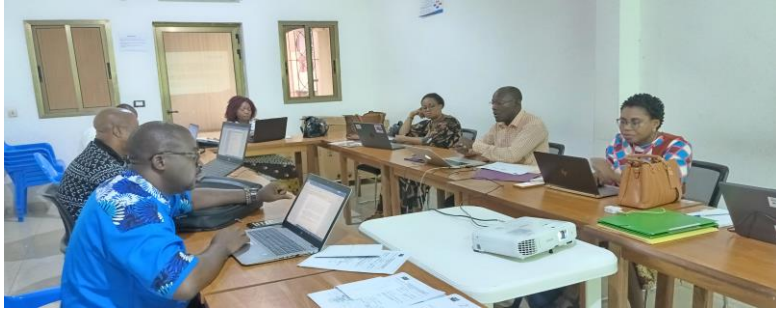
Rencontre avec les membres du bureau de la Plateforme