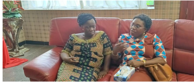
Savec Docteur Bleu, Chargée de Communication au PNL Péance de travail